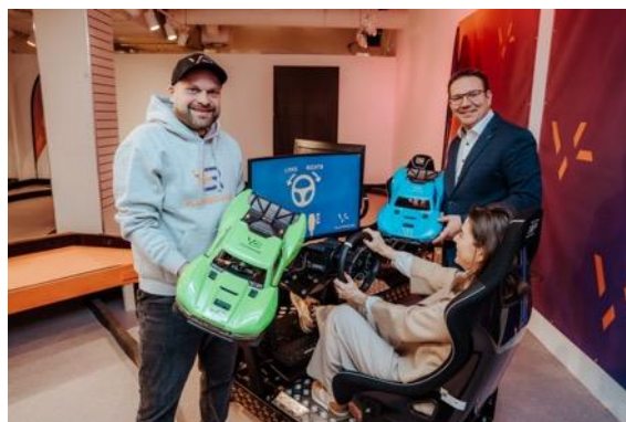
02 CCA VBR Playground.jpg