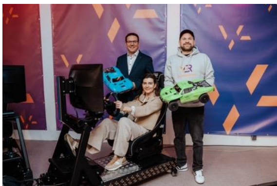
01 CCA VBR Playground.jpg

Um die abgebildeten Fotos in Druckqualität herunterzuladen, bitte auf die blauen Hyperlinks klicken.