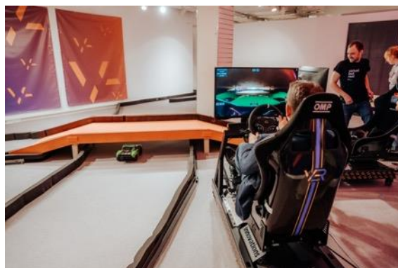
04 CCA VBR Playground.jpg

Bildtext: DER VBR Playground ist von Mittwoch bis Samstag von 13 bis 18 Uhr bis 4. Jänner im CCA 1, Ebene 2 für Besucher:innen geöffnet.